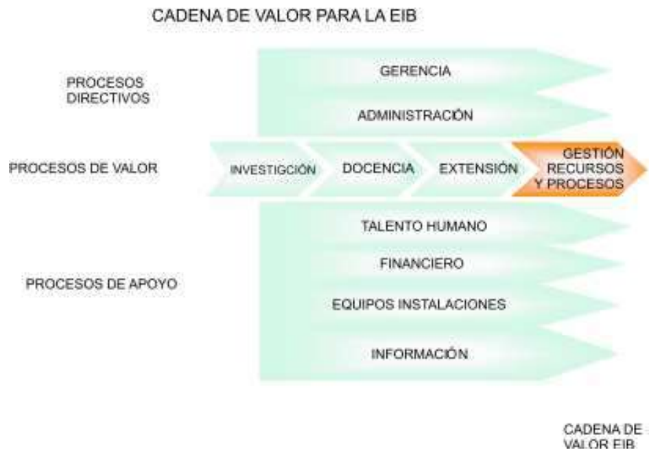
Figura 1 Cadena de valor sugerida para la EIB

La cadena de valor de la EIB dispone de tres tipos de procesos: los directivos, los de valor y los de apoyo.