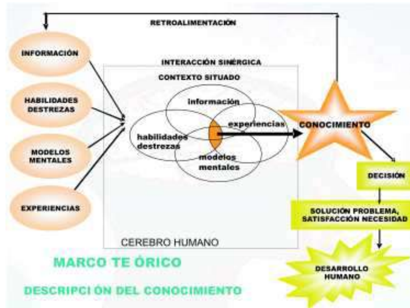
Figura 2 Descripción del conocimiento

Al acudir a una representación gráfica del conocimiento, podría representarse como se muestra a continuación (Ver Figura 2 ):