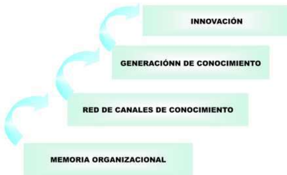
Figura 3 Concepción estratégica del modelo de GC, EIB

La concepción estratégica representa el camino a seguir en forma sistémica en lo relativo a la GC para llegar a la innovación, como se ilustra en la siguiente gráfica (Ver Figura 3 ).