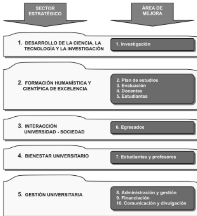
Gráfico 2 Estructura de análisis y planificación

Con los resultados anteriores y el análisis de las fortalezas y debilidades del Programa, el paso siguiente fue la construcción del plan de mejoramiento o plan de acción, para lo cual se formaron como base y estructura de planificación los sectores estratégicos contemplados en el Plan de Desarrollo 2006-2016 de la Universidad 11 , asociando las áreas que se consideran necesitadas de atención o mejoramiento para el Programa (Ver Gráfico 2 )