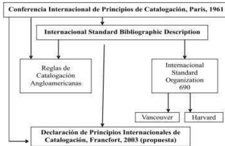
Figura 3 Relaciones de influencia en la normatividad bibliográfica

En este sentido, resulta pertinente retomar el marco de los principios de catalogación y de las normas ISBD. Para reforzar dicho marco se presentó una versión preliminar de la Declaración de Principios Internacionales de Catalogación, aprobada en el 2003 en Alemania, en la ciudad de Francfort.