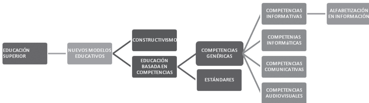
Gráfica 1. La alfabetización informacional: contexto y términos relacionados

Para la búsqueda de la información se localizaron y revisaron documentos de acuerdo a temas establecidos previamente en un guión, el cual fue elaborado a partir de un esquema de términos que inicialmente se consideraron útiles y que pueden observarse en la Gráfica 1. La revisión de la literatura se entendió como el proceso de detectar, obtener y consultar los materiales de interés para el estudio.