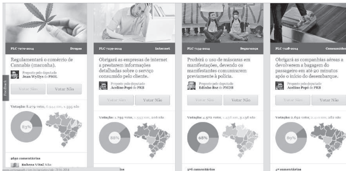
Figura 2. Ejemplo del Portal “Vote na web”

En Chile, la plataforma Ciudadano Inteligente tiene como objetivo mantener la información pública disponible y fomentar la participación ciudadana. De este proyecto nace Vota Inteligente . Es solo una parte de esta plataforma, otras herramientas permiten monitorizar otros aspectos de la vida política. La novedad de Vota Inteligente es su pretensión en relación con la apertura y reutilización de los datos en bruto ( Raw Data ). Tiene convenio con la Biblioteca Nacional del Congreso de Chile para asegurar las recomendaciones en relación con datos abiertos. Uno de sus objetivos es la preocupación por la reutilización de información para valor añadido.