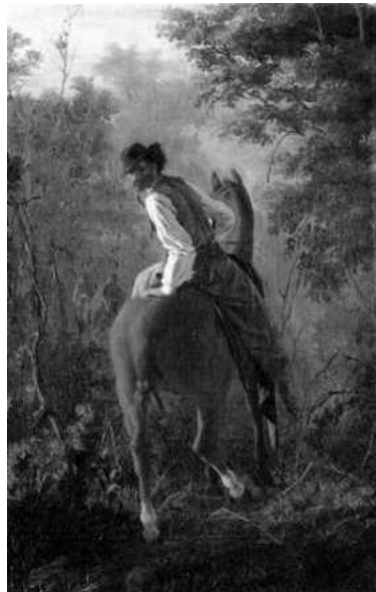
Figura 1 «Amanecer» Óleo de Juan Manuel de Blanes, 1875

Surge del mestizaje del europeo con el indio de la región y adopta de este último muchas pautas culturales (Ver Figura 1 ).