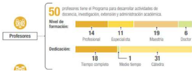
Gráfica 2. Características de los profesores de Archivística.

sionales de la Universidad: docencia, investigación y extensión, además de la administración académica. De estos, 6 tienen título de doctor, 19 de maestría, 11 de especialización y 14 profesionales; 18 están contratados de tiempo completo, 1 medio tiempo y 31 por hora cátedra. Se destaca el ingreso de 7 docentes en los últimos dos años, todos con formación posgraduada, en áreas como administración de archivos, gestión documental, transparencia y acceso a la información, historia y gestión de la información y del conocimiento.