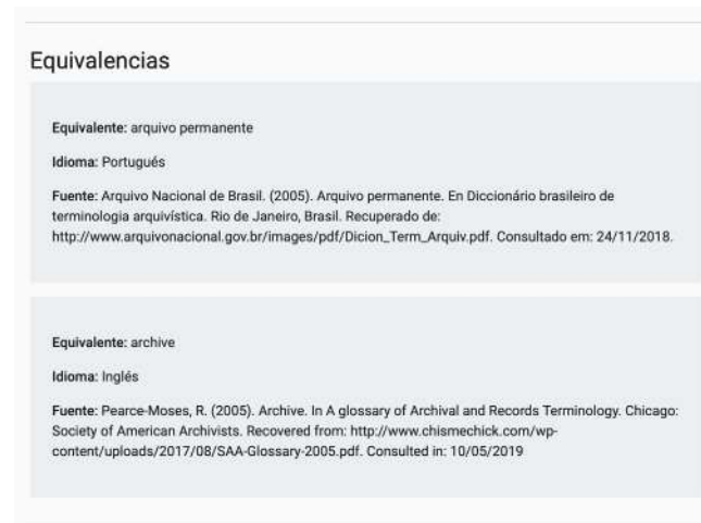
Figura 3. Equivalentes en inglés y portugués del término archivo histórico .

to, casos como el del término archivo ilustran bien esta problemática. En efecto, el equivalente en inglés, según el glosario de la Sociedad Americana de Archivistas, es archives , en plural, mientras que archive corresponde en el contexto colombiano a archivo histórico . La Figura 3 ilustra este caso.