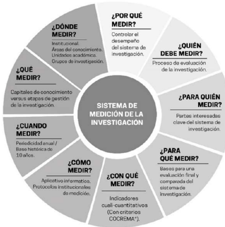
Figura 1. Consideraciones previas a un sistema de medición.

En consonancia con lo anterior, se propone un sistema de medición de las actividades de CTI para una institución de investigación, especialmente la universitaria, configurado a partir de las cuatro condiciones mencionadas (concepción, estructura, procedimientos e instrumentos), cuyo desarrollo se explica como sigue: