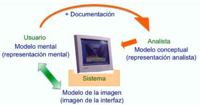
Figura 1. Teoría de la acción de Norman: tipos de modelos

Los modelos mentales reflejan el conocimiento del individuo y su organización. Norman (1983) establece la diferencia de tres tipos de modelos: el modelo mental del usuario, el modelo conceptual del analista, que en este caso también podría ser el del profesional de la información, y el modelo de la imagen del sistema. Siendo que el modelo mental es la representación mental que el usuario se hace de su tarea y de su ambiente de trabajo, el modelo conceptual es la representación que el diseñador (sea el analista o el profesional de la información) hace del sistema; y la imagen del sistema contempla desde la imagen de la interfaz hasta los aspectos físicos y dispositivos de comunicación ( figura 1 ).