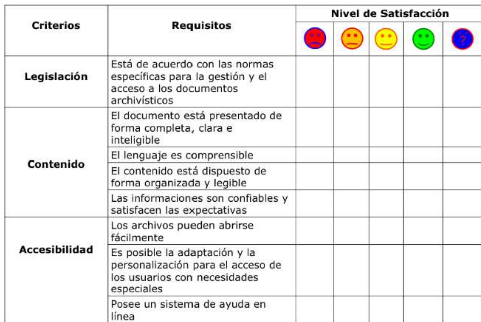
Figura 3. Criterios de evaluación de la usabilidad de un Sistema Informatizado de Gestión Archivística de Documentos – SIGAD

serción de datos, la capacidad para recibir documentos de diferentes formatos de archivo y la estructura de ítems de seguridad y de usabilidad, criterios que fueron considerados importantes para la composición de un SIGAD eficiente y seguro en la guarda y gerenciamiento de documentos, tanto en soporte en papel como digital.