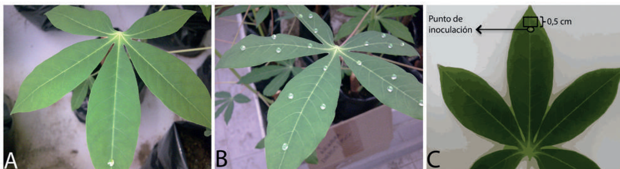
Figura 1. A. Método de inoculación utilizada de plantas de yuca ( Manihot esculenta Crantz) en los ensayos de histología. B. Método de inoculación de las hojas utilizadas en los ensayos de transcriptómica. En ambos casos, se colocaron 10 μl del cultivo bacteriano una DO_{600nm} = 0,2 en cada punto de inoculación. C. Esquema del experimento de la evaluación fenotípica microscópica de la enfermedad. Para seleccionar el tejido empleado en los cortes de parafina se hizo un corte en forma de cuadrado tangencial al punto de inoculación

Construcción del microarreglo de ADNc. Los microarreglos se construyeron a partir de colonias que contienen los insertos de ADNc de cada uno de los 5.700 genes únicos (López et al. 2004, López et al. 2005). Estas bacterias se encuentran organizadas en 14 placas de 384 pozos y se encuentra disponible en el CIAT. Los insertos fueron amplificados por PCR a partir de los clones de bacteria. Los productos de PCR se secan y se resuspendieron en buffer de impresión (NaCl 0,45 M, citrato de sodio 0,045 M y betaína 1,5 M) y finalmente se transfirieron a placas de 384 pozos para ser impresos sobre láminas de vidrio cubiertas con poly-L-lisina (ThermoScientific, Waltham, MA, U. S. A.) usando un pin de 6X4 del SPBIO Microarray Spotting Station ubicado en el CIAT. El ADN de los microarreglos se denaturó al ubicar la lámina de vidrio sobre una plancha caliente