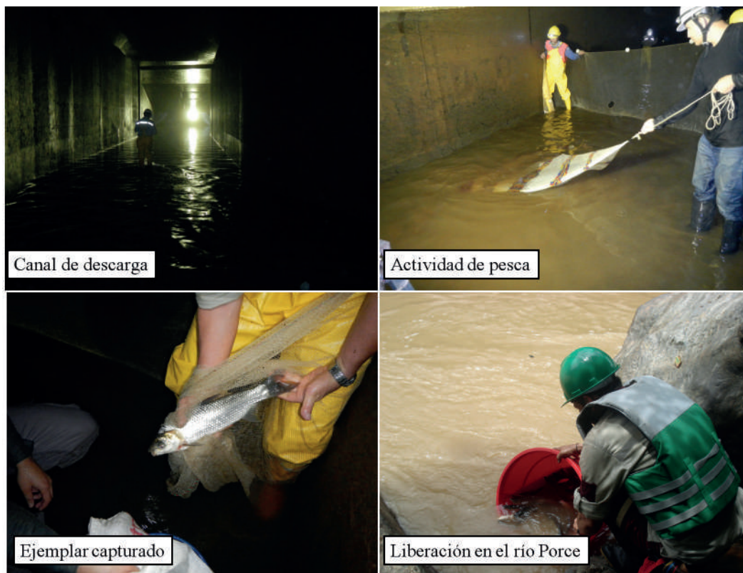
Figura 2. Registro fotográfico del rescate de peces en el canal de descarga de la central Porce III.

Entre los años 2012 y 2015 se realizaron tres actividades de rescate de peces en el túnel de descarga de la central Porce III (figura 2). Con la ayuda de un equipo que proveía energía eléctrica pulsada (método de pesca eléctrica) los peces fueron aturdidos y capturados con la ayuda de redes de arrastre (chinchorro: 5 m longitud, 3 m alto, 1 cm de abertura de malla) y de caída (atarrayas con diferentes aberturas de malla y altura: 0,5 cm y 2 m de alto y 2 cm y 4 m de alto); inmediatamente fueron depositados en canecas con agua, con oferta permanente de oxígeno y solución tranquilizante (eugenol) según lo recomendado por Javahery et al. (2012). Los ejemplares capturados fueron identificados hasta el nivel de especie, según la categoría taxonómica actualizada a 2015 (Eschmeyer y Fong 2017). Para esto se emplearon las claves taxonómicas de Buckup (1992), Dahl (1971) y Maldonado-Ocampo et al. (2005) así como las descripciones contenidas en Jiménez-Segura et al. (2014). Posteriormente, los peces vivos fueron liberados en el río Porce (figura 2).