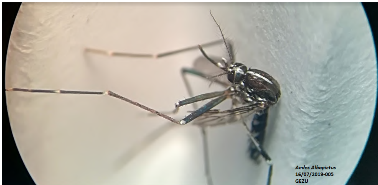
Figura 2. Vista dorsal del tórax de Ae. albopictus , espécimen recolectado en el área de influencia del Proyecto Hidroeléctrico Ituango. Antioquia.

Un comportamiento similar se observó para los estados inmaduros con un 47,3% de las capturas en peridomicilio y un 52,7% en el extradomicilio. No se registraron capturas en el embalse.