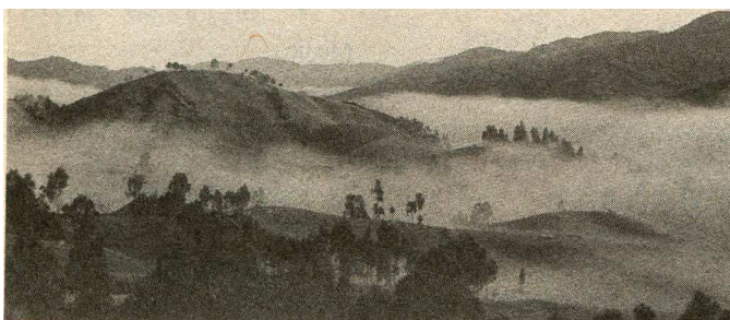
Paisaje. Fotografías de Juan Diego Escobar y de Helver Valderrama. Parte de estas obras estarán expuestas del 4 al 21 junio en la Sala de Exposiciones de la Biblioteca Central.

De otro lado, y en forma paralela al Festival, La Facultad de Artes de la Universidad de Antioquia, la Cámara de Comercio de Medellín y Egresartes, han programado la Segunda Muestra Artística de Egresados de la Facultad. El objetivo es estimular el trabajo de los egresados y mejorar la apreciación artística de la Ciudad.