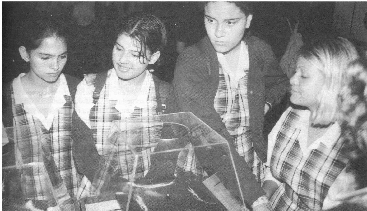
Imagen EXPOUNIVERSIDAD 96.