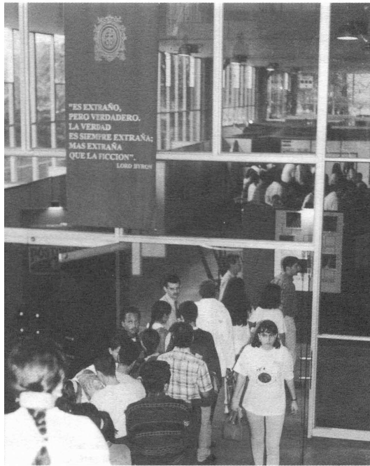
Imagen EXPOUNIVERSIDAD 96.

a la validación social directa, y de cierre del ciclo de generación de saber para el desarrollo y el mejoramiento de la calidad de vida.