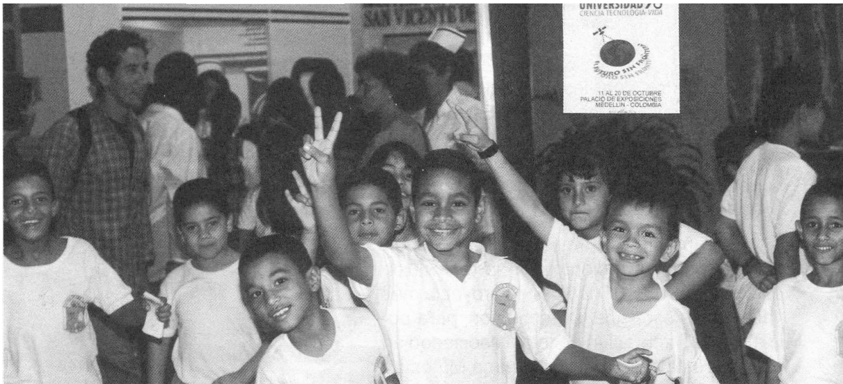
EXPOUNIVERSIDAD 96.