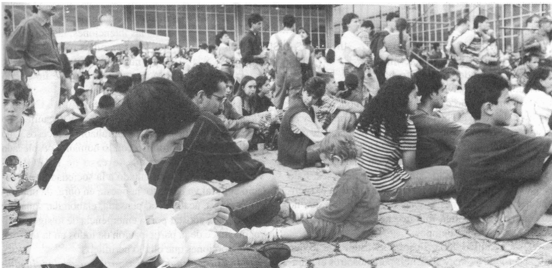
Imagen EXPOUNIVERSIDAD 96.

Tal como el Comité Científico lo decidió y planteó en el documento o guión temático al inicio y divulgación de la actual feria, y tal como fue aceptado por los organizadores de esta actividad universitaria, el tema de esta versión: