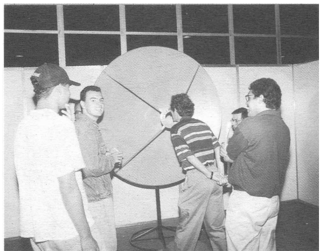
Imágenes EXPOUNIVERSIDAD 96.