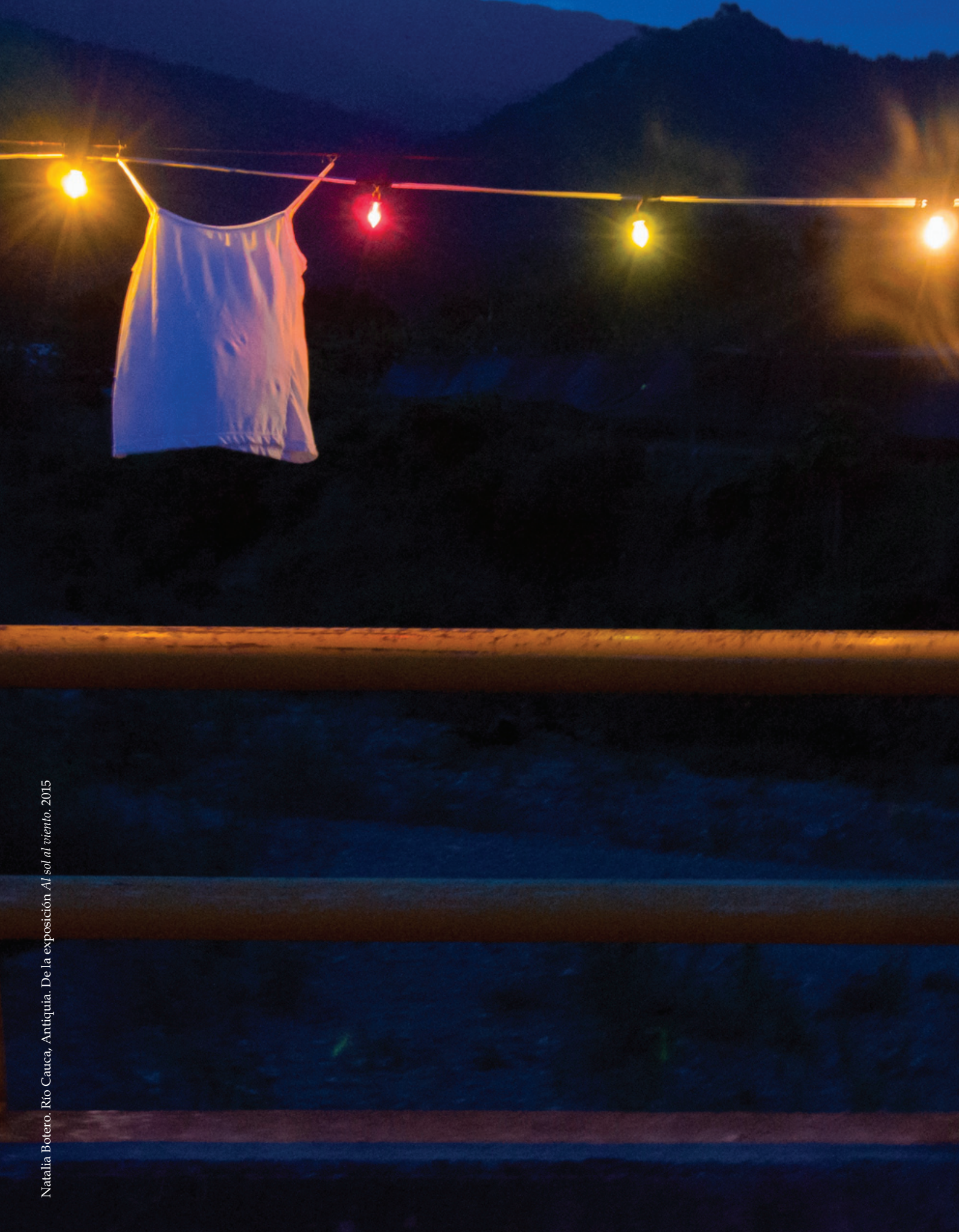
Natalia Botero. Río Cauca, Antiquia. De la exposición Al sol al viento . 2015