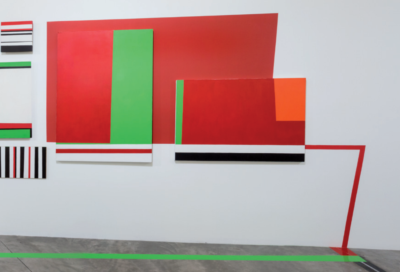
Beatriz Olano, Entrelazado , acrílico sobre lienzo, MDF, pared y piso, dimensiones variables, 2005.

un nombre, unos edificios, unas técnicas y en unos objetos estáticos que dejaban a un lado la propuesta renovadora y disruptiva características de la escuela de hace un siglo.