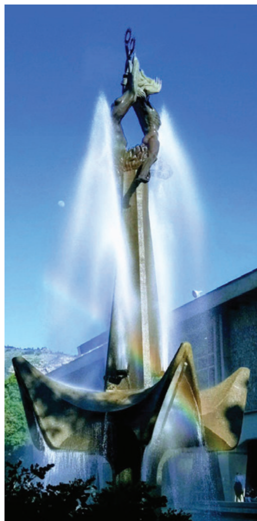
Rodrigo Arenas Betancourt. El hombre creador de energía . Bronce y concreto. 18 m. 1968. Universidad de Antioquia. Foto: Mauricio Hincapié Acosta

De esta manera, el análisis sobre la obra pública dará cuenta de su incidencia en la construcción de procesos identitarios y del servicio a la sociedad para generar otros imaginarios, así como de los retos en materia de conservación y pedagogía de las propuestas artísticas.