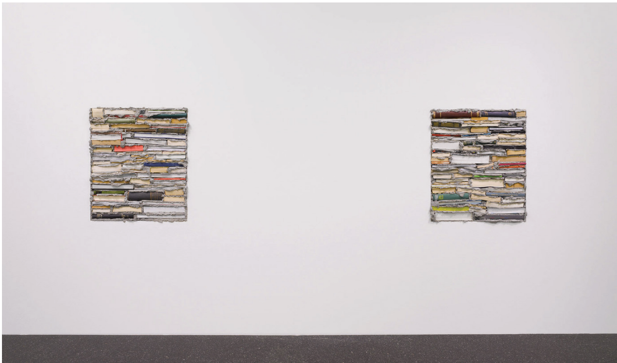
Luis Camnitzer. Fenster . 2001