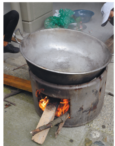
Días de cuerpos

En el primer año trabajamos desde la virtualidad en un intento de generar comunidad a través de la pantalla, forjar lazos para no desfallecer, porque para algunos, el encierro fue una experiencia difícil, que trajo miedos, dudas, tristeza; pero en abril