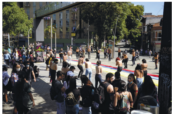
Con guerra no brazos