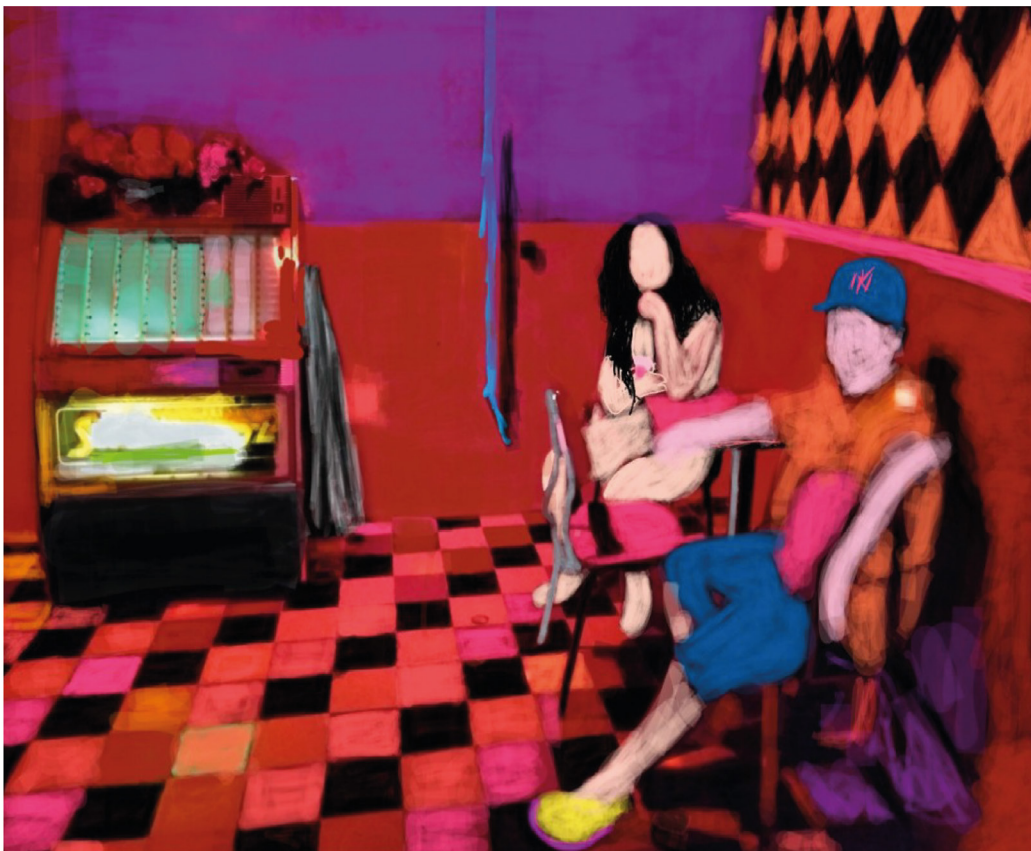
ErreMora (Morata). Pintura digital. https://www.instagram.com/morata_studioart/

Ante nuestra conciencia se presentan dos misterios inasibles: la realidad y la ficción. Entre uno y otro, no nos es posible saber cuál de los dos es el más verdadero. La verdad está muy por encima de ambos misterios y de nuestro alcance.