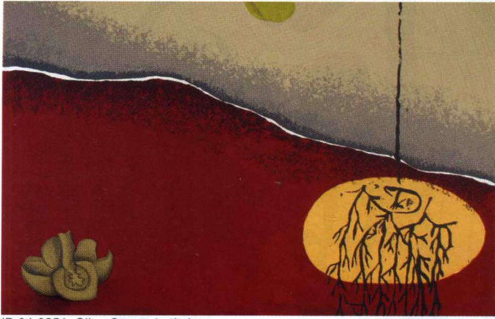
ID.94-0251, Oliva Cano, sin título, diptico, serigrafía, 5/12, 1994