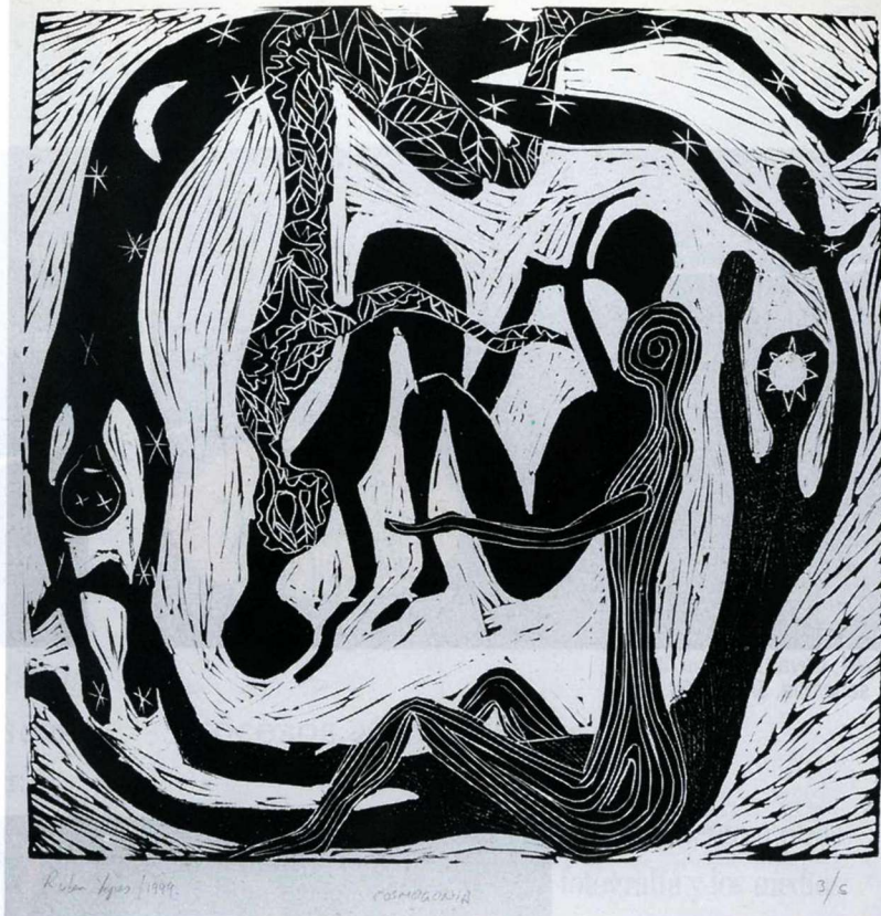
ID.99-0701 (DSC_1133) Rubén Yépes, Cosmogonía , linóleo, edición: 3/5, 1999

La Administración de la Facultad aportó para cubrir el costo de este trabajo, que incluye la toma fotográfica, revelado y ampliación del material en formato 10 x 15 cm. Durante todo el 2001, el monitor de la Colección, estudiante de la carrera de artes plásticas,