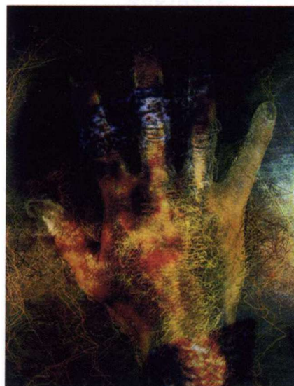
ID.05-1190, Oscar González, sin título, impresión digital, 2005