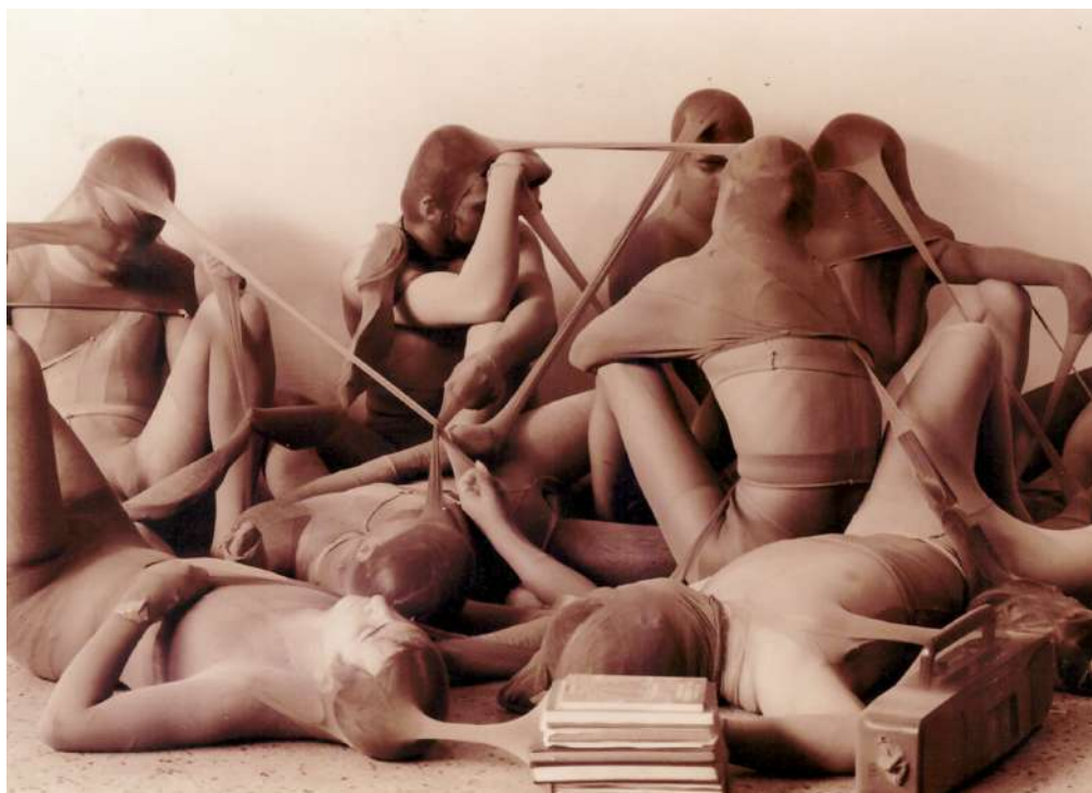
Figura 6 Registro fotográfico de la obra Relaciones (1994), con los integrantes del Grupo Universidad de Antioquia, luego llamado A-clon