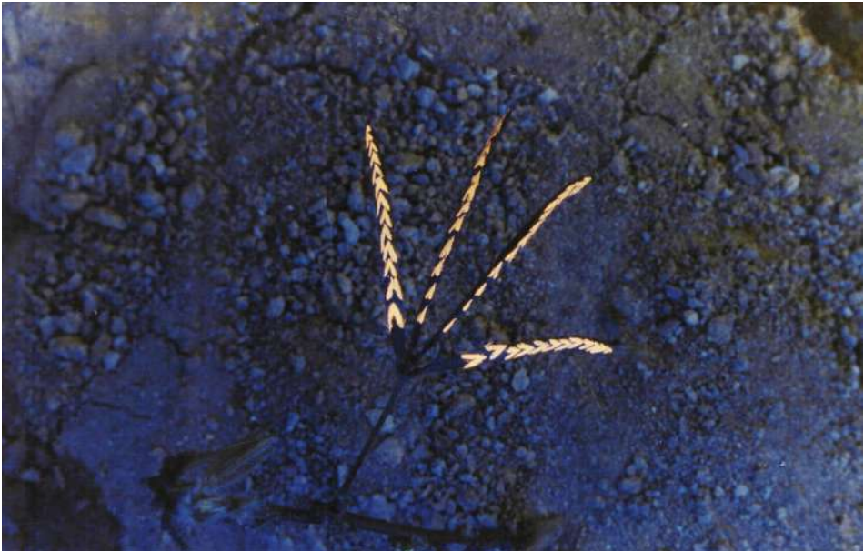
Figura 3 Primera parte de la serie Hojas y horas (1992), de Maryluz Álvarez, en la cual vemos cómo se unen los puntos de la planta al cerrar sus hojas una vez cae la noche. Para conseguir este efecto la artista utilizó pintura fluorescente no tóxica sobre las hojas de la mimosa púdica, que popularmente se conoce como “dormilona”