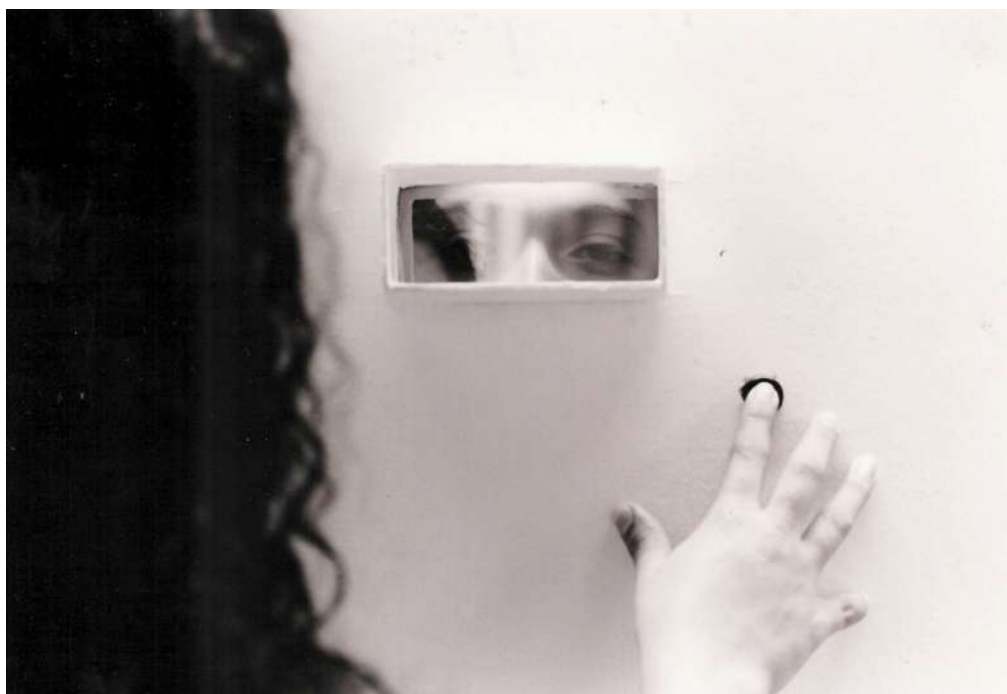
Figura 7 Registro fotográfico de la obra Observador observado (1995), con los integrantes del Grupo Universidad de Antioquia, luego llamado A-clon