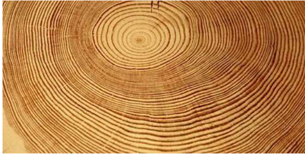
Figura 2 Fotografía de los anillos de crecimiento de un árbol. A través de ellos es posible determinar su edad, ya que crecen cada año. Aunque son solo visibles cuando el árbol es talado, existen algunos métodos de medición en la actualidad como el que se obtiene mediante el uso de la barrena de Pressler, que extrae una muestra del tronco sin afectar sus ciclos naturales