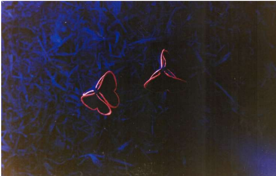
Figura 4 Segunda parte de la serie Hojas y horas (1992), de Maryluz Álvarez, esta vez llevada a cabo sobre los contornos de dos tréboles. El movimiento de estas plantas al caer el sol es menor, por lo que el cambio es poco visible