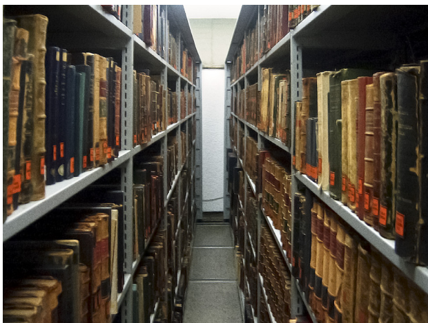
Figura 1. Colección Patrimonio Documental - Entre archivador rodante. 2012