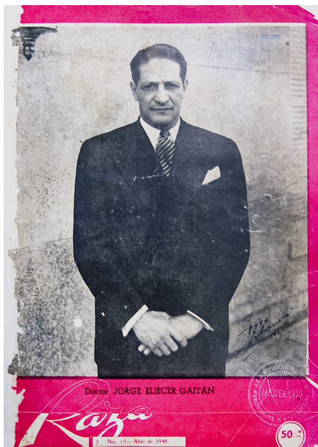
Figura 5. Portada revista Raza #19, abril de 1948 (Colección Antioquia). 2012