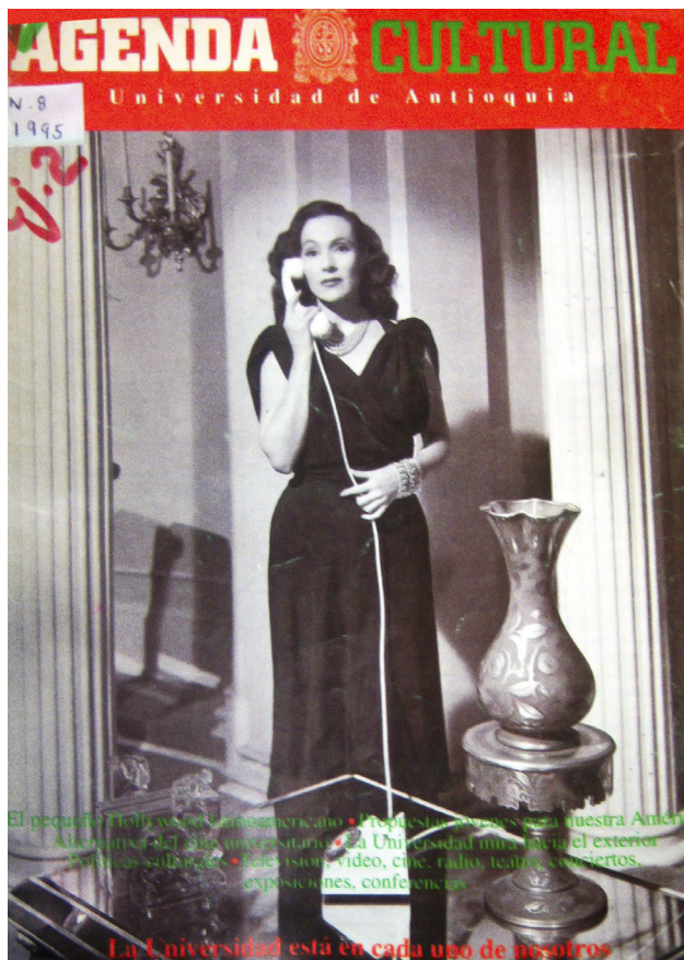
Figura 2. Agenda Cultural, Universidad de Antioquia #8 de 1995 (Colección Antioquia). 2011