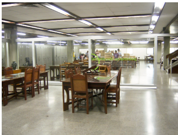
Figura 6. Salas de Consulta del cuarto piso (Al fondo la Colección de Periódicos). 2012