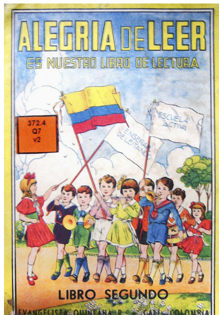
Figura 4. La Alegría de leer, Juan Evangelista Quintana. Edición de 1937 (Patrimonio Documental). 2011