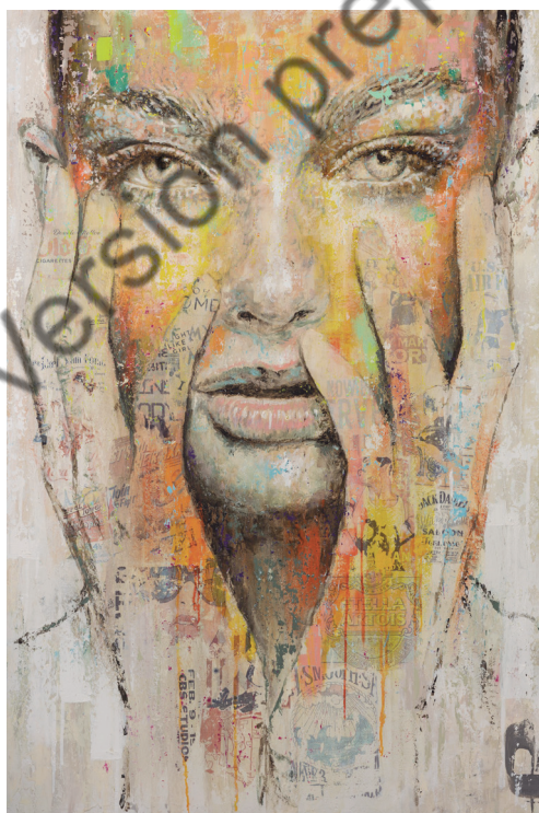
Gerardo Labarca, Girl.10 , técnica mixta, 101,6 × 152,4 × 38,1 cm, 2021. Chica.10 es una obra que transmite deseo a través de una mirada perfecta. Los acrílicos utilizados presentan tonos cálidos, y su expresión está envuelta en diversos collages que la rodean.