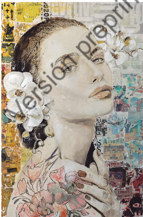
Gerardo Labarca, Dreamer:10 , técnica mixta, 101,6 × 182,88 × 38,1 cm, 2023. Soñadora.10 es la mirada del deseo, tatuada con flores, y adornada con otras, todas pintadas en acrílico. Collages rodean el personaje en tonos cálidos y neutros.

La primera obra de Gerardo Labarca, Chaplin , es el resultado de un trabajo de collages puestos en escena, buscando siempre una variedad, e interponiendo capas que nos revelan más y más detalles.