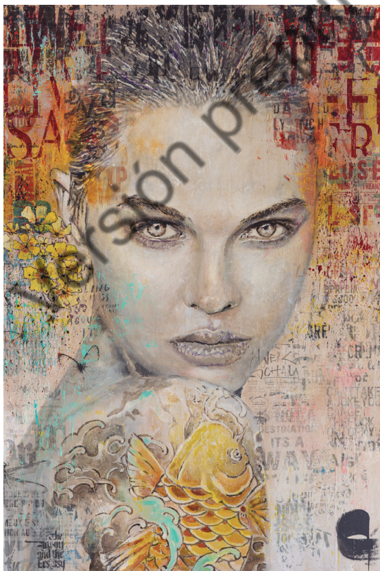
Gerardo Labarca, Dreamer:14 , técnica mixta, 101,6 × 182,88 × 38,1 cm, 2025. La soñadora, una figura femenina adornada con numerosos collages , nos narra una historia. Con tonos anaranjados y letras rojas, muestra un tatuaje en su hombro, orgullosa de ser quien es, como lo refleja su mirada segura y confiada.