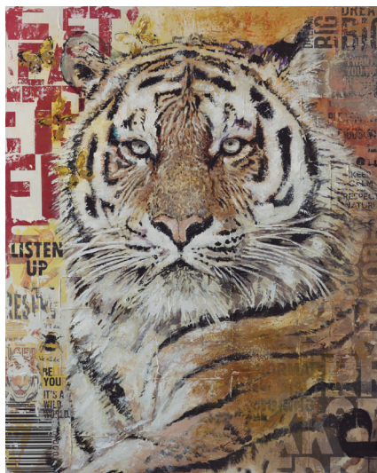
Gerardo Labarca, Bengala , técnica mixta, 101,6 × 152,4 × 38,1 cm, 2022. Retrato de arte animal. Gerardo Labarca nos invita a la conservación y el respeto de la vida silvestre. Los collages y el color naranja exaltan la figura representada.