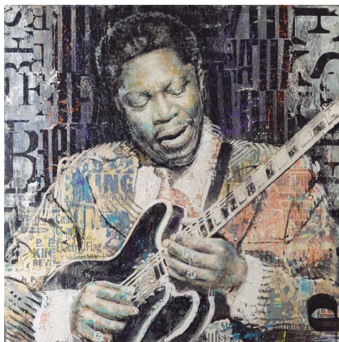
Gerardo Labarca, B. B. King , técnica mixta, 101,6 × 121,92 × 38,1 cm, 2022. B. B. King, un destacado artista del jazz, es representado en un collage que refleja las letras de sus canciones, su vestimenta y escenas de sus conciertos, logrando una composición en la que se visualiza la música emergiendo del cuadro.