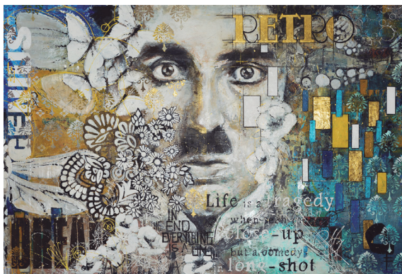
Gerardo Labarca, Chaplin , técnica mixta, 101,6 × 182,88 × 38,1 cm, 2018.

La primera obra de Gerardo Labarca, Chaplin , es el resultado de un trabajo de collages puestos en escena, buscando siempre una variedad, e interponiendo capas que nos revelan más y más detalles.