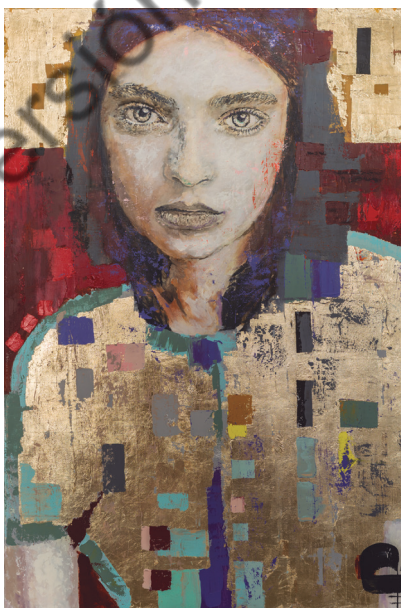
Gerardo Labarca, Akya , técnica mixta, 101,6 × 152,4 × 38,1 cm, 2024. Con tonos neutros y el uso del color rojo para dividir el espacio, guía al espectador a concentrarse en la mirada inocente del personaje. Gerardo se inspira en Gustav Klimt para incorporar formas geométricas.