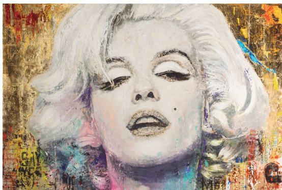
Gerardo Labarca, Marilyn Alive , técnica mixta, 101,6 × 182,88 × 38,1 cm, 2025. Marilyn Monroe ha sido una musa indiscutible en la obra de Gerardo Labarca, siempre presente como su título, en tonos brillantes y cálidos acrílicos. Su expresión invita a observarla detenidamente. La hoja de pan de oro ilumina todo el cuadro, añadiéndole un toque refinado y luminoso.