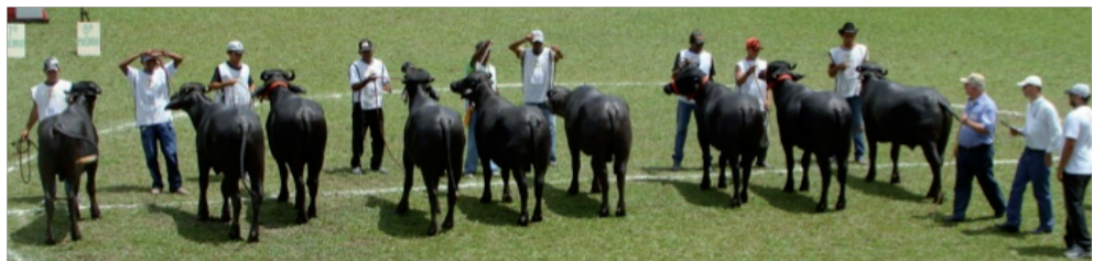
Figura 2.3. Exposición de búfalos en orden de clasificación

animales unas veces en movimiento y otras veces quietos, manteniendo el esquema que se indica en la figura 2.1.