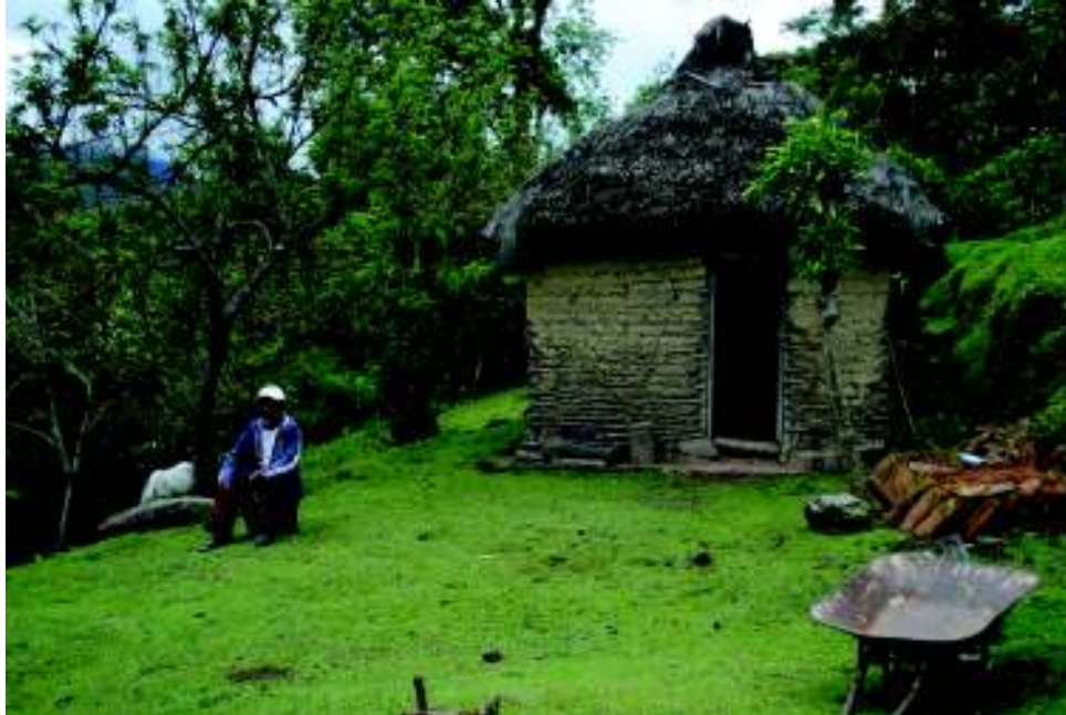
Figura 3. Mayor nasa en casa trabajadero en Tarabira (Cauca)

antigua, 15 la Estación Tálaga presentaba unas condiciones climáticas y ecológicas diferentes, aunque tenía una ventaja comparativa importante, la cercanía a la vía principal Popayán–La Plata, lo cual posibilitaba la comercialización de los productos agrícolas. Las condiciones geográficas mostraban una diferencia sustancial con respecto a Tálaga Antigua pues mientras en este el terreno estaba en el rango altitudinal de los 1700 a 1900 msnm, en el nuevo territorio el rango oscila entre los 2100 y los 2600. Aunque se mantenía la topografía montañosa, el clima es más frío, entre 10 y 16 °C (Cabildo indígena nasa Paez de La Estación Tálaga, 1999); condición climática que es referida comúnmente por ellos cuando evocan la memoria sobre el proceso productivo adaptativo en la región. Al respecto, y en relación con Tierradentro, la situación no fue fácil, pues en esta zona debieron emplear abonos, orgánicos o químicos, para lograr niveles de productividad aceptables comparativamente hablando con el lugar de origen en Tálaga Antigua. Por tal motivo, algunas personas no soportaron estas condiciones y optaron por regresar de nuevo a Tierradentro. Otros decidieron quedarse, ya que “era terrible” pensar en volver a su