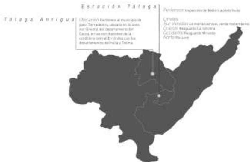
Figura 2. Ubicación del resguardo indígena de Tálaga. Municipio de Páez-Belalcázar

Posteriormente, fueron trasladados a la vereda El Hato, en el municipio de Inzá (departamento del Cauca), donde permanecieron cinco meses en una cancha deportiva. Al respecto, narran que la incertidumbre los invadía porque desconocían dónde iban a ser reubicados definitivamente. Por esto el Cabildo y la Corporación Nasa Kiwe empezaron a hacer gestiones para conseguir áreas de asentamiento más estables. Se comenzó a mirar alternativas de reubicación en ciudades capitales medianas y pequeñas como Popayán (Cauca) y Pitalito (Huila), y en otros territorios de resguardos como Novirao (municipio de Totoró), Miraflores (municipio de Silvia), y lo que ahora se llama La Estación Tálaga. Una vez estudiadas las posibilidades de reubicación la CNK adquirió dos fincas que eran conocidas como “La Llave” y “La Gaitana”, en los límites de los departamentos de Cauca y Huila, a casi dos horas de la cabecera municipal de La Plata, por una vía destapada (véase figura 2).