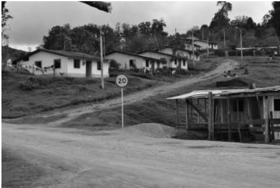
Figura 4. Patrón nucleado nasa de la Estación Tálaga

miembros que iban a habitar la casa, y en algunas se acogía a los trabajadores, el baño estaba lejos de la casa y los materiales de construcción se sacaban del territorio (Calambás, C., 2011). En tercer lugar, si bien las familias recién asentadas adoptaron el ipxkwet o la tulpa, quizá como una forma de mantener el núcleo de integración familiar alrededor del fogón, con la llegada del nuevo modelo de vivienda de la CNK, dicho valor fue desarticulado, pues la hornilla, ya no establecida en las tres piedras, sino en una estructura de cemento a una altura de medio cuerpo y confinada a un espacio más reducido, terminó imponiendo otro tipo de posiciones más individualizadas. Ello se vio reforzado con la separación de espacios, que buscaba en principio la asignación individual para cada miembro de la familia. Con el tiempo, algunos de estos aspectos asociados a la nasa yat pudieron ser constatados, lo cual nos lleva a un segundo momento dieciséis años después y en el cual el patrón de asentamiento pasó de ser disperso a uno más nucleado (2013) (véase figura 4).