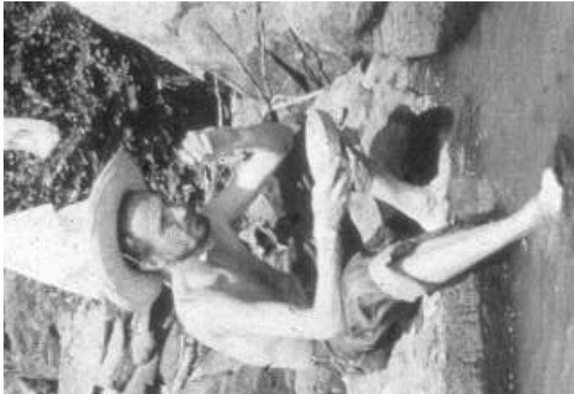
Figura 1. Mario Terribilini. Tomada de Terribilini, Mario (2001). Les Makús aux confins de L'Amazonié . Vevey, DactyleService, p. 179.