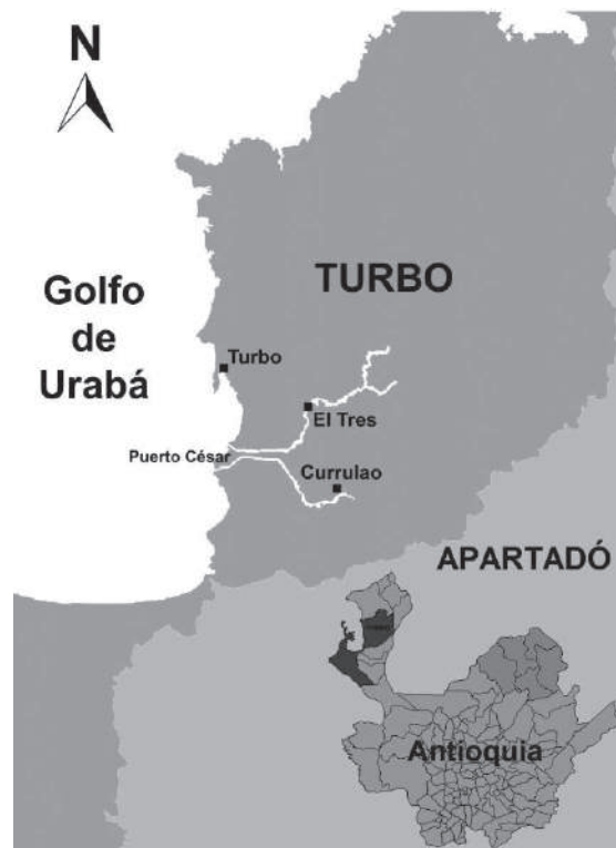
Figura 1. Localización geográfica de la vereda Puerto César

El caserío de La Playa se encuentra localizado a orillas del golfo de Urabá, en el caserío Puerto César, ubicada en la vía que comunica los municipios de Apartadó y Turbo, entre los corregimientos de Currulao, al cual pertenece, y El Tres; nombres con los que se conoce a los ríos que la enmarcan en su recorrido hacia el golfo (véase figura 1). Este caserío, cuya configuración actual data de una década aproximadamente, es el lugar de asentamiento de un grupo de familias desplazadas provenientes de otros corregimientos, veredas o municipios del Gran Urabá (Antioquia, Córdoba y Chocó), de donde son oriundas, o que constituyeron sitios de tránsito en la búsqueda de las fluctuantes oportunidades de trabajo ocasionadas por las economías de enclave en la región, o en procura de un refugio en el proceso de desplazamiento forzado. 2