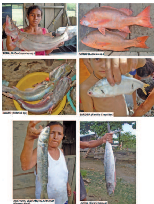
Figura 3. Algunas especies de importancia pesquera en el golfo

Candelaria y Pava en el verano es que se coge más pescado. En este tiempo, invierno, para encerrar pescado, pa' coger jurel encerrado, sale en cardumen, como el mar está quieto, pega este viento, no hace mareta ni nada, entonces la sardina se aglomera y sale el jurel. Los pescados caminan más pa'llá en el verano, pega el róbalo y pega el pargo, en el verano que hay mareta (pescador, 41 años, 3 de abril de 2013). 6