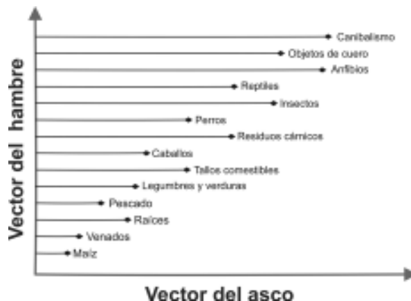
Gráfico 2. Distribución de los alimentos en los vectores del hambre y del asco

Aquí, el asco rige, según lo muestra el gráfico 2. Es un comportamiento que los cronistas consideran repulsivo, aunque justificable. Al respecto, Fray Pedro Simón es elocuente al afirmar que el hambre era tal que “no había sapo ni culebra ni otro animal venenoso e inmundo que no probasen” (Simón, 1981, vol. 3: 109).