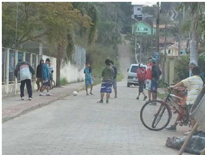
Figure 4. Des adolescents en train de s'amuser devant le portail d'entrée de l'école.

Dans ce récit, la reconnaissance apparaît en tant que demande de type territoriale et environnementale sur laquelle le développement continu rend possible l'existence des habitants et des jeunes en dehors des drogues et de la marginalisation. La reconnaissance constitue un complément de théories de la démocratie (Zask, 2011 : 291). Le souhait d'un don notamment du pouvoir public est une étape indispensable dans la négociation de l'école au nom de la communauté, et donc de reconnaissance. Dans le raisonnement de notre interlocutrice, en connaissance de cause, ces terrains seront « garantis » pour le projet Entorno Escolar seulement avec leur insertion dans le dispositif municipal d'occupation du sol, le Plan directeur d'urbanisation de la ville, en liaison avec la participation et la lutte communautaire. Cependant on voit que la municipalité n'est pas intéressée par ce projet car elle l'a écarté du Plan directeur de la ville approuvé début 2014.