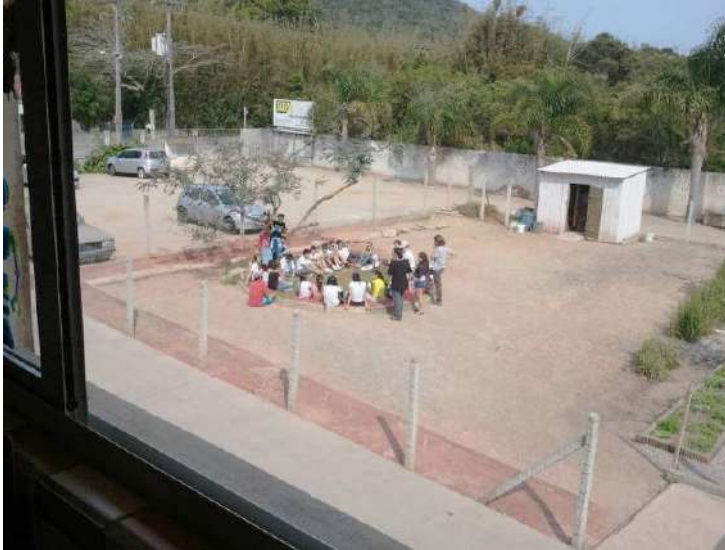
Figure 2. Réalisation du Projet « Plantar e Colher: um jeito de aprende »

C'est dans ce contexte que l'école s'inscrit dans les pratiques liées à l'environnement. Par au-delà de ses murs et par le principe de la logique collective, cette école a l'objectif principal de construire une société de plus en plus critique et engagée à l'éthique et aux valeurs de la nature et du groupe social.