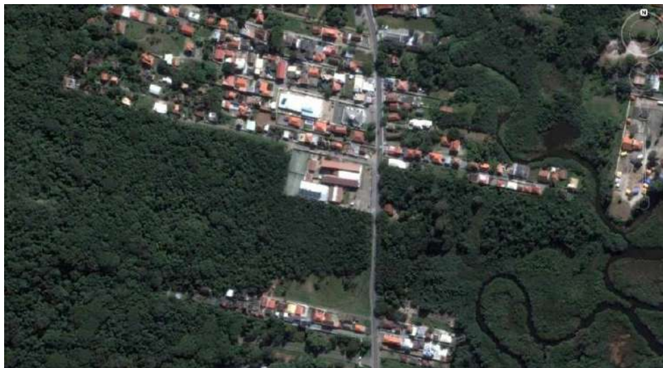
Figure 3. L'école et le corridor écologique vus du haut.

Ainsi, appuyé sur la législation urbaine et environnementale, le projet Entorno Escolar (expliqué en grandes lignes dans l'introduction), conçu par la communauté scolaire, revendiqué depuis 2005 auprès de la mairie de Florianópolis l'expropriation de trois terrains vides situés autour de l'école Dilma Lucia dos Santos, d'à peu près de 100 ha (y compris l'école), qui englobent une diversité d'écosystèmes et de paysages. L'aire configure un Corridor écologique entre deux domaines protégés: le Parc municipal de Lagoa do Péri (2030 ha) et le Parc municipal de Lagoinha do Leste (480,5 ha), qui garantit la liaison entre les écosystèmes marins et côtiers de la Forêt Atlantique.