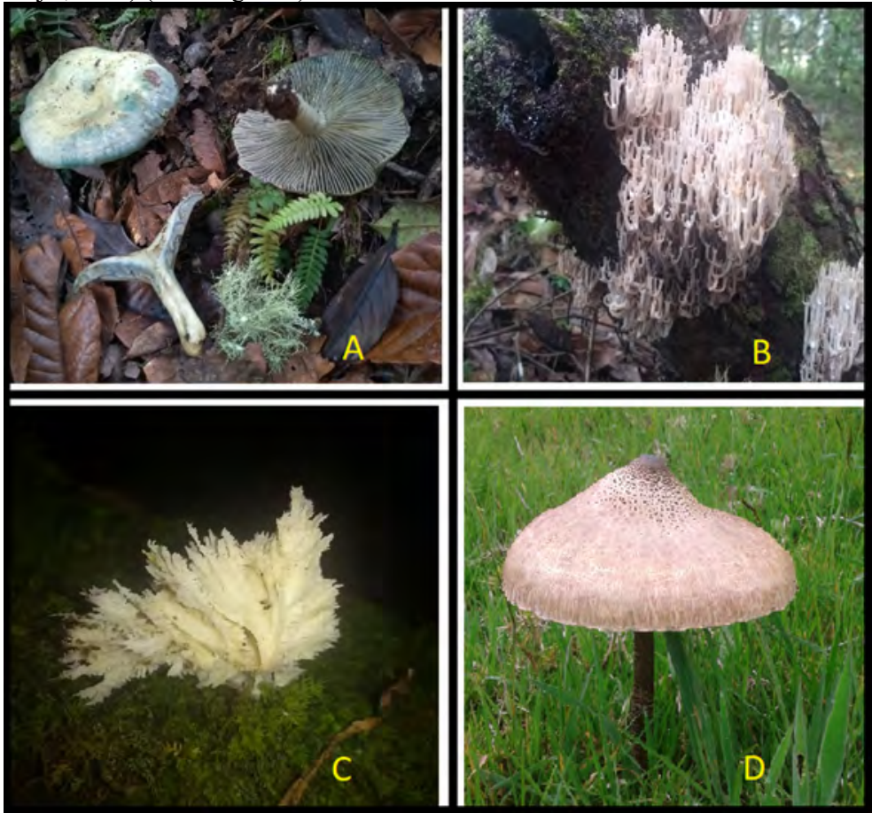
Figura 3. Hongos comestibles en la comunidad de la vereda La Dorada. A) Lactarius indigo ; B) Artomyces pyxidatus ; C) Hydnopolyporus sp.; D) Macrolepiota sp.

sp.), pechugas o cayambas ( Hydnopolyporus sp.) y arbolitos, ramitas o cayambas ( Artomyces pyxidatus ). Se tienen datos similares sobre el uso de estos hongos en comunidades de los Andes nororientales de Colombia, en el departamento de Boyacá, pero en esta región se reconocen con otros nombres comunes, como cocas ( Artomyces pyxidatus ) y lechucitas ( Macrolepiota colombiana ) (Peña-Cañón y Enao-Mejía, 2014) (véase figura 3).