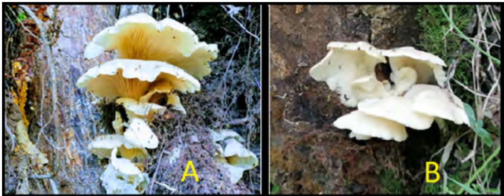
Figura 2. Hongos comestibles del pueblo Kokonuco. A) Lentinus concavus ; B) Pleurotus sp.

Los hongos de uso alimenticio, como el Lentinus concavus y Pleurotus spp. (véase figura 2), fueron observados y descritos durante el trabajo de campo en el municipio de Puracé, en el que se encontró que estos hongos son llamados “kallambas” por la comunidad. A través de los recorridos realizados, se observó a los sabedores buscar estos hongos en madera en descomposición y en árboles vivos como el palo bobo o árbol de balsa, del género Heliocarpus , en los bosques húmedos. De forma similar, el uso del término “callampas” se ha reportado en el municipio de La Vega (Macizo Colombiano, Cauca), identificado como Pleurotus ostreatus , los cuales son recolectados y utilizados como alimento por las comunidades campesinas e indígenas de la región. Estos últimos se encuentran en forma silvestre sobre el tronco de árboles en estado de descomposición de balsa ( Heliocarpus popayanensis ), higuerón ( Ficus sp.) y aliso ( Alnus acuminata ) (Potosí-Gutiérrez, Villalba-Malaver y Arboleda-Pino, 2017). Los Pleurotus son igualmente de interés alimenticio en comunidades de la Amazonia peruana (García et al. , 2014). En el caso de Lentinus concavus , es consumido por indígenas Andoques, Muinanes y Uitotos en la Amazonia colombiana (Vasco-Palacios et al. , 2008). Asimismo, comunidades en Ecuador lo utilizan con diferentes nombres vernáculos: en la costa lo denominan “Anj kijiutiu” y el pueblo Zapara de la Amazonia lo llama “Aunika katsapija” (Gamboa-Trujillo et al. , 2019).