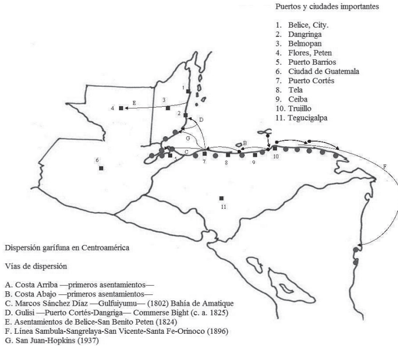
Figura 1. Dispersión garífuna en Centroamérica. El gráfico señala las diversas vías de dispersión a partir del puerto de Trujillo (A y B), y otras posteriores (Puerto Cortés: C y D; Belice: E; Sangrelaya: F; y San Juan: G) todas apuntando a la consolidación de la territorialidad de los garínagu