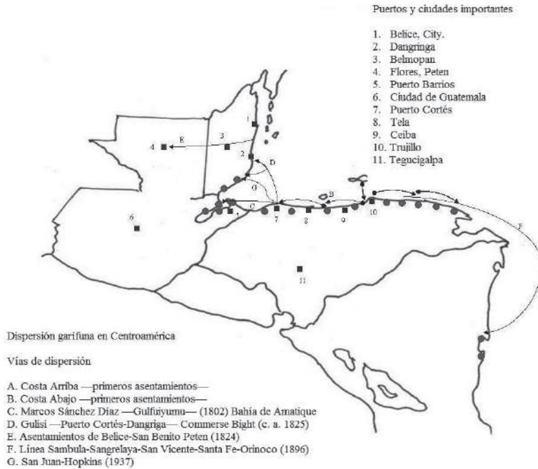
Figura 1. Dispersión garífuna en Centroamérica. El gráfico señala las diversas vías de dispersión a partir del puerto de Trujillo (A y B), y otras posteriores (Puerto Cortés: C y D; Belice: E; Sangrelaya: F; y San Juan: G) todas apuntando a la consolidación de la territorialidad de los garínagu