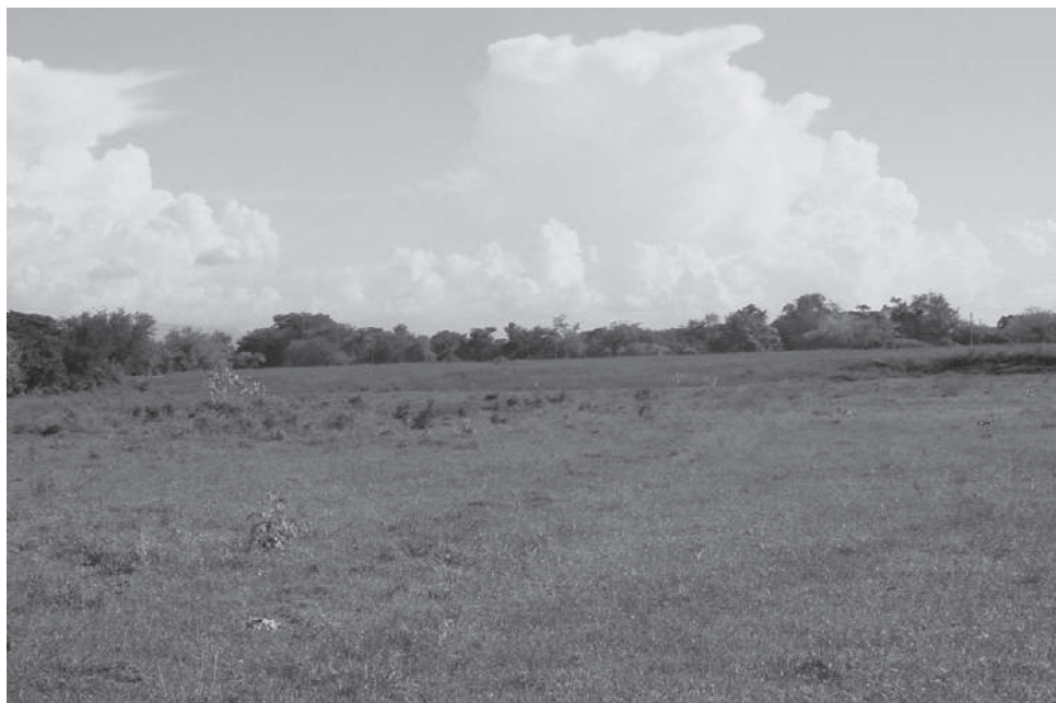
Figura 2. Panorámica del sitio arqueológico

de Guamo; el paisaje es suavemente ondulado con algunas zonas bajas inundables y partes más altas, donde se ubicaron evidencias de antiguos asentamientos prehispánicos. La altura de la terraza varía entre 327 y 330 msnm y su extensión es de aproximadamente nueve hectáreas (520 x 170 m). El área correspondiente al sitio arqueológico y sus alrededores pertenecen al gran paisaje del abanico de Guamo, que fue disectado por corrientes jóvenes del Holoceno, entre ellas las del río Luisa. Este proceso ha generado cambios en el relieve, donde se conservan zonas altas y quebradas que corresponden a restos del abanico de Guamo, y zonas más bajas y planas que presentan características similares a las del abanico de Espinal, que es más joven (véase figura 2).