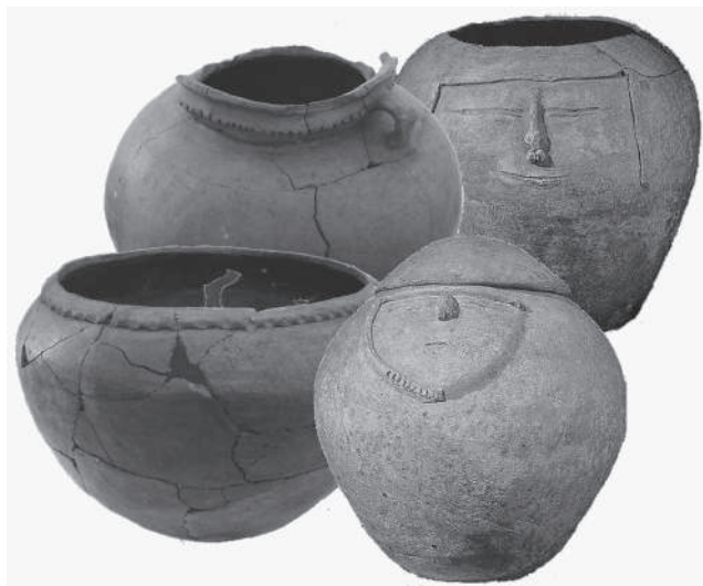
Figura 8. Formas cerámicas del complejo Magdalena Inciso

El estilo alfarero del periodo Tardío ha sido reportado en varios lugares del territorio descrito anteriormente. Sus materiales se caracterizan por la presencia de vasijas sencillas de mediano y gran tamaño, acompañadas por otras que pueden hacer las veces de tapas. También son comunes los recipientes globulares con asas, cuencos, platos, figurinas sólidas y volantes de huso con motivos incisos; la decoración más frecuente es la incisión en diversos diseños geométricos, el pastillaje con diferentes trazos incisos presionados, muescas y baños de tonalidades rojas y cafés (Salgado, 1998; Salgado et al., 2006) (véase figura 8).