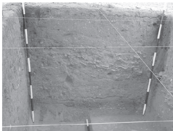
Figura 5. Perfil de la U. E. 13, pared oeste

A partir de las características naturales de los diferentes suelos, de la actividad antrópica, de otras evidencias culturales (principalmente la cerámica) y de las dataciones absolutas, fue posible inferir que, en el sitio La Esmeralda, se conservó el testimonio de una larga ocupación humana con tres diferentes momentos, pertenecientes a distintos periodos cronológicos y culturales, en un lapso que abarca entre 1.500 a 2.000 años de duración aproximadamente. Dicha secuencia se describe tomando como base las unidades 1 y 13 —pues fueron las excavaciones con un área más grande (U. E. 1) y de mayor profundidad (U. E. 13)—, ubicadas sobre la parte más alta y plana de la terraza. La descripción que se presenta comienza en el horizonte más profundo hasta la superficie actual; asimismo, la relación de las ocupaciones se hace a partir de su temporalidad, desde la más antigua a la más reciente (véase figura 5).