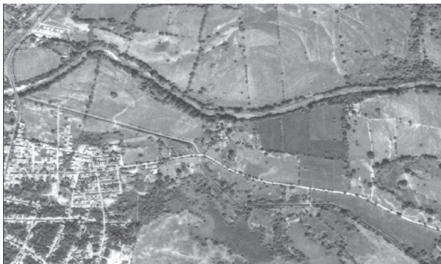
Figura 3. Vista aérea del sitio La Esmeralda

Las terrazas que se identifican en la fotografía aérea corresponden a diferentes procesos de formación. El sector donde se construyó la zona urbana del municipio de Guamo (Zu) pertenece a restos del abanico de Guamo (es el lugar más alto, antiguo, disectado y erosionado), con suelos menos aptos para la agricultura; en contraste, la terraza ( T_1 )—donde se encuentra el sitio arqueológico— es una zona alta (la segunda con respecto al nivel del río) con las mismas características estructurales del abanico de Espinal y similares. La terraza ( T_2 ) es la formación que más se repite en la zona; se localiza cerca de los cauces y meandros abandonados, y fue muy influenciada por los desbordes del antiguo curso ( Ca_1 ). Esta terraza presenta materiales que provienen del río Luisa y se encuentra en la misma posición estratigráfica del abanico de Espinal; son terrenos más bajos con suelos más jóvenes y fértiles, y por tanto más aptos para la agricultura (véanse figuras 3 y 4).