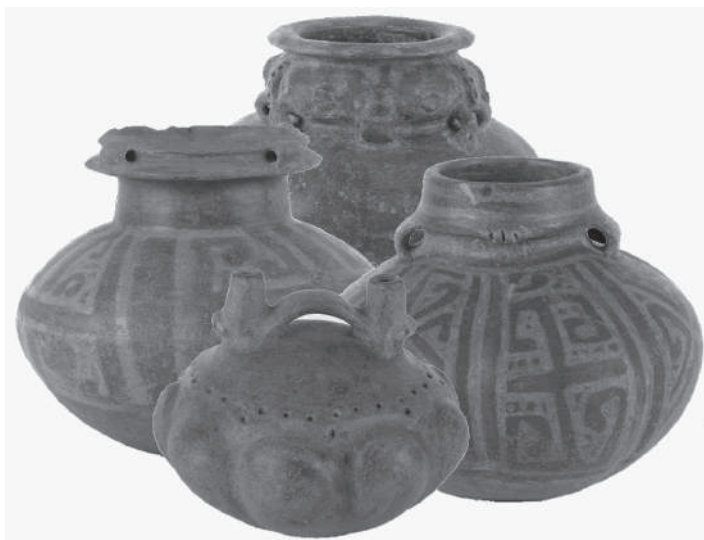
Figura 7. Formas cerámicas del complejo Guamo Ondulado

un 95% de probabilidad) ayudan a conjeturar un periodo de desarrollo, para el complejo Guamo Ondulado, entre los inicios del siglo II y la parte media del siglo VII d. C.