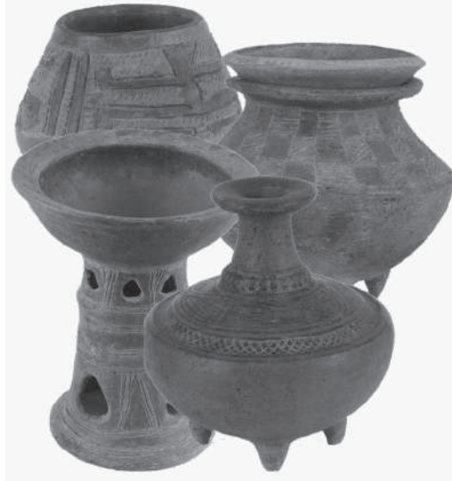
Figura 6. Formas cerámicas del complejo Montalvo