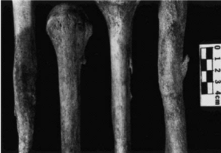
Figura 4. Grados de osificación en diferentes sitios de inserción en el húmero, de izquierda a derecha corresponden a los grados Os1, Os2 y dos ejemplos de Os3 (Hawkey y Merbs, 1998: 332)

tensiones relacionadas con actividad. El método propuesto por Hawkey y Merbs permite la observación y clasificación de estos marcadores; adicionalmente, tiene ventajas como un bajo índice de error inter e intraobservadores, límites identificables y establecidos para cada marcación, además de que los autores proporcionan fotografías que hacen la guía para la calificación simple e inteligible.