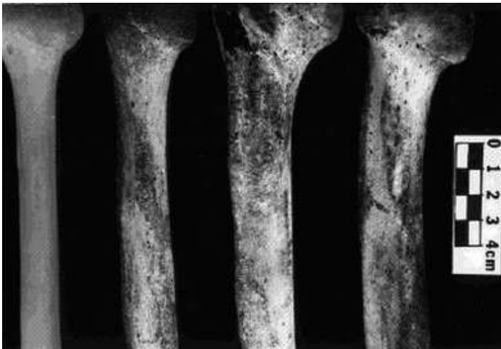
Figura 1. Grados de robustez en el sitio de inserción del pectoral mayor. De izquierda a derecha corresponden a R0, R1, R2 y R3 (Hawkey y Merbs, 1998: 329)

R3 = Fuerte. Se han formado crestas agudas o canales distintivos. Una ligera depresión entre las dos crestas se encuentra frecuentemente, sin embargo no se extiende dentro de la corteza (véanse figuras 1 y 2).