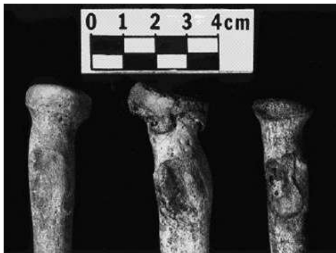
Figura 2. Categorías de robustez en el sitio de inserción del bíceps. Grados R1, R2 y R3 de izquierda a derecha (Hawkey y Merbs, 1998: 330)