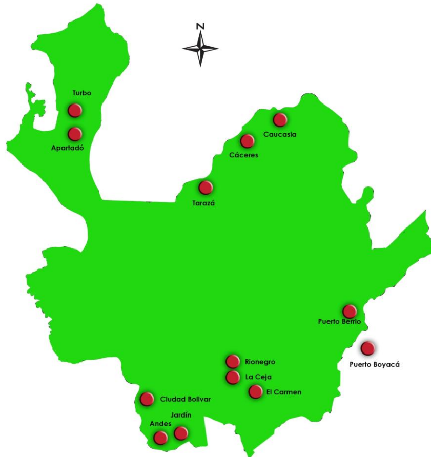
Figura 1. Mapa del Dpto. de Antioquia con municipios de aplicación de grupos focales

y con ellas se realizaron talleres orientados por un moderador para inducir las a que manifestaran sus conceptos perceptivos para lograr con ellos la construcción de las dimensiones que son objeto de este estudio.