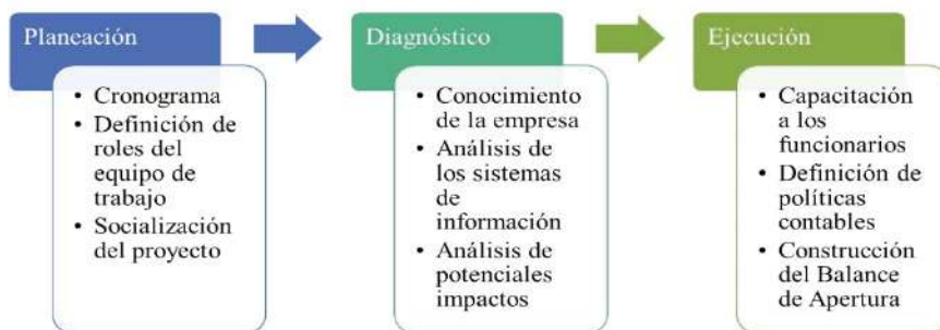
Figura 2. Etapas del proceso de implementación en el caso sector privado