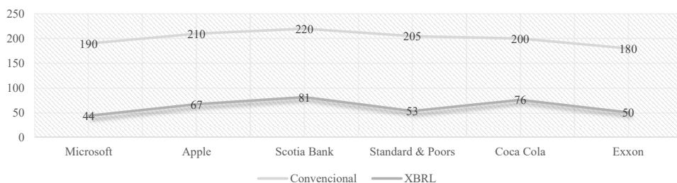
Grafico 1. Horas por mes para el registro y emisión de informes

En promedio, algunos estudios han manifestado que el XBRL reduce los tiempos de creación de informes hasta en un 75% ó 80%. Bajo ese escenario, un ejemplo de la reducción bajo casos hipotéticos basados en un promedio de 270 horas mensuales de trabajo contable sería el siguiente: