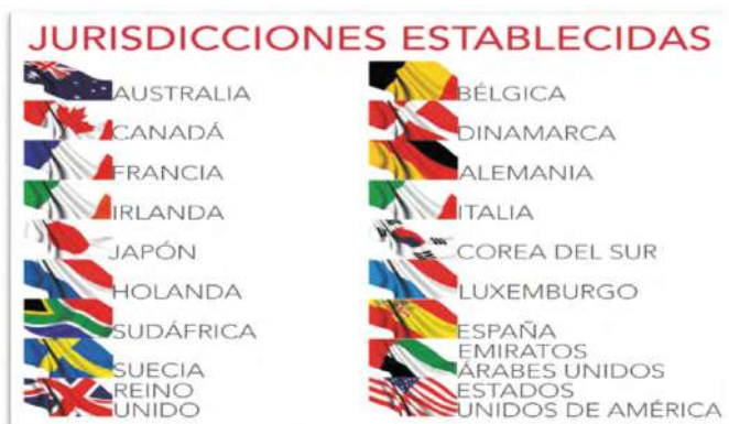
Ilustración 1. Los países que mayor incidencia en implementación del XBRL.