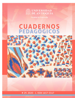
Ilustración de portada