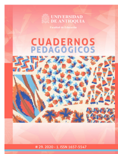
Ilustración de portada