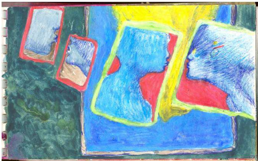
Elmer Restrepo, Puzolana . Collage, 2011

“Hasta el día que sufrí mi primera parálisis, mi vida era un conglomerado de hechos más o menos con sentido y armonía. Entendía la contradicción, y hasta el dolor, como parte de esa confrontación entre el mundo y lo que soy en el tiempo y en cada una de las partículas que lo componen. Pero cuando ocurrió el accidente, comprendía algo que estaba más allá de todas las ideas que podía haber aprendido o hasta inventado. Comprendí que existía únicamente como carne, materia, moléculas condenadas a transformarse en partículas que ignorarían las sutilezas de mis sentimientos.”