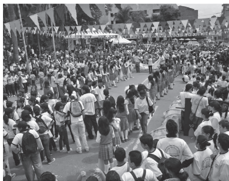
Fotografía 1. Fase nacional.

Llama la atención que estos juegos, sosteniendo una prédica superadora del deportivismo tradicional escolar, identifican nacional e internacionalmente a una práctica educativa masiva de alta cobertura social. Práctica social que logra constituirse como una estrategia significativa a la hora de considerar críticamente los procesos de integración posible entre escuela, comunidad y Gobierno; entre prácticas recreativas y deporte; entre activismo mancomunado del estudiantado, directivas educativas y profesorado; entre instituciones escolares y no escolares; entre sector educativo municipal urbano y sector educativo municipal rural; entre deporte y comercio; entre juego y catequesis; entre deporte y orden social.