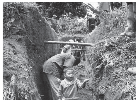
Figura 1. Juego-trabajo en la minga.

Un conjunto de actividades realizadas por la comunidad como prácticas de juego en el gran territorio, son las acciones propias de su cotidianidad, como las funciones emprendidas para resolver las necesidades colectivas (la minga) y las actividades que garantizan el asociacionismo, la unidad y la integración (las asambleas, la minga y la participación en organizaciones comunales). En la minga se destaca el espíritu de entrega a la labor y a los procesos de integración que allí se dan, como la chanza, la ‘conversa’, el alimento, la bebida y el baile, todas posibilidades humanas de reconocimiento y afianzamiento de la confianza y del disfrute como forma de existir en el mundo.