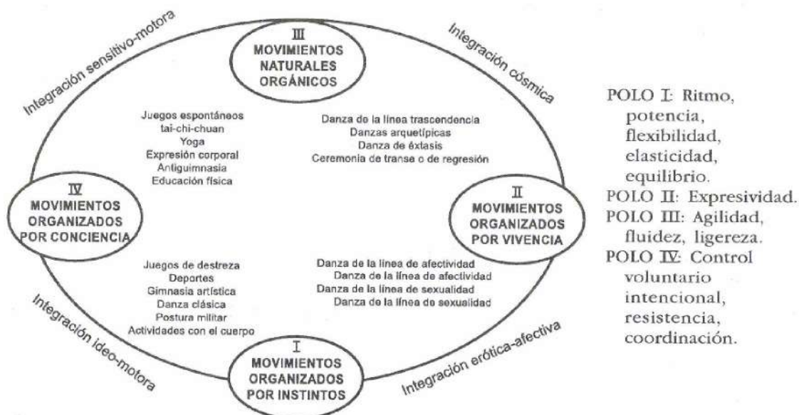
Figura 1. Distribución de diversas disciplinas dentro del modelo sistémico del movimiento humano. Fuente: adaptación realizada por Castañeda y Chalarca (2004), de Toro (2002: 133)

En este sentido, Toro plantea diferentes clases de movimientos como se ilustran en la Figura 1: