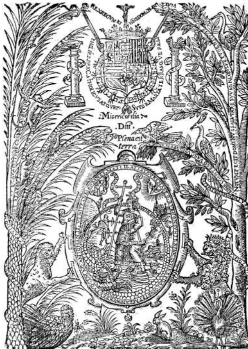
Figura 1. Frontispicio de las Elegías