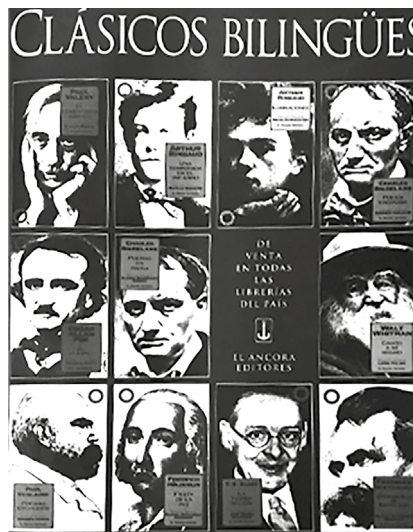
Figura 3. Publicidad en Magazine Dominical de El Espectador, abril de 1995.