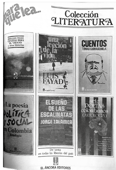
Figura 2. Publicidad en Magazine Dominical de El Espectador, mayo de 1985.