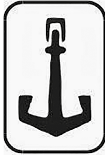
Figura 1. Logo de El Áncora Editores.