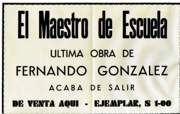
Figura 1: Afiche ubicado en 1941 en la Librería La Pluma de Oro