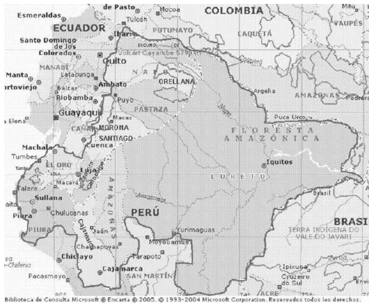
Mapa 2. ZIF de Ecuador y Perú