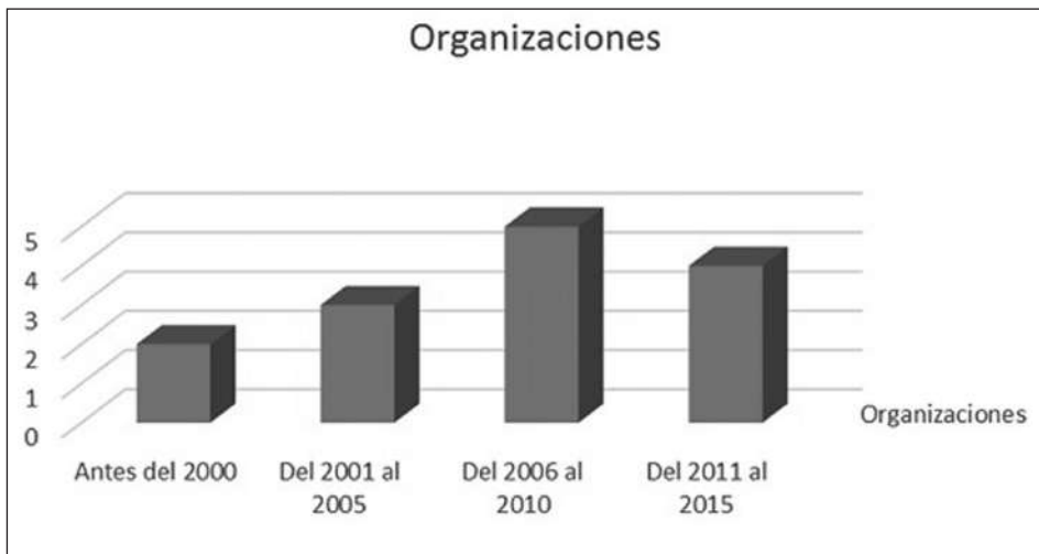
Gráfica 2. Creación de organizaciones por periodo.

Los procesos organizativos aluden a la conformación de grupos y organizaciones comunitarias de víctimas, de mujeres, de jóvenes, artísticas y culturales para la consecución de fines específicos. También dentro de esta clasificación se ubican aquellas acciones en las que existe articulación en torno a procesos de autoconstrucción o autosostenimiento, con o sin apoyo de organizaciones. La Comuna 3 tiene un amplio historial de procesos organizativos, entre los que resaltan la conformación de organizaciones como Comadres, Riobach, Asfadesfel, Antígonas y Aventureras (Taller FA, 6 de diciembre, 2014).