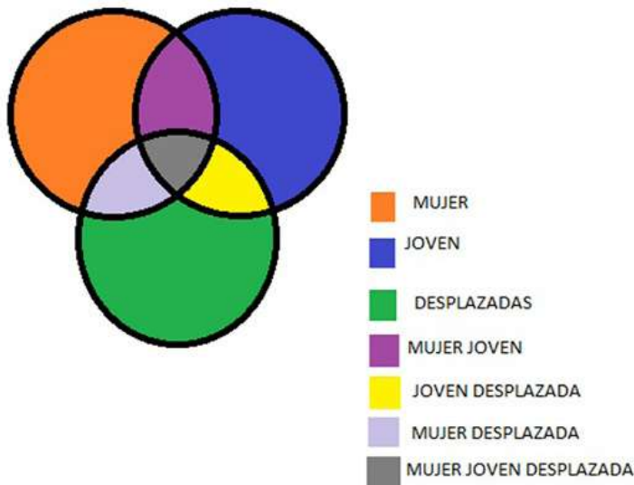
Gráfica 1. Diagrama simple de intersección.

Para comprender lo anterior resulta útil un diagrama simple de la intersección de mujeres jóvenes en situación de desplazamiento. Este se basa en la lógica de conjuntos, en donde la intersección se crea cuando un conjunto, para este caso «mujeres», contiene elementos del conjunto «jóvenes», y los dos anteriores comparten elementos con un tercer conjunto, «desplazadas». Es en estas uniones de los conjuntos donde se crean las intersecciones y se profundizan las exclusiones: